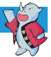
学研災キャラクター サイちゃん

拝啓 時下益々ご清祥のこととお慶び申し上げます。この度、お子様の合格を心よりお祝い申し上げます。