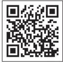
(金融庁ホームページ)

保険金額等の設定は、高額療養費制度や労災保険制度等の公的保険制度を踏まえご検討ください。公的保険制度の概要につきましては、金融庁のホームページ ( https://www.fsa.go.jp/ordinary/insurance-portal.html ) 等をご確認ください。